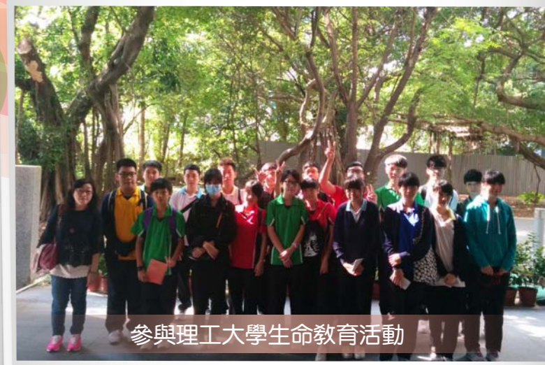
參與理工大學生命教育活動