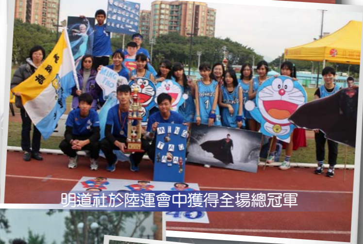
明道社於陸運會中獲得全場總冠軍