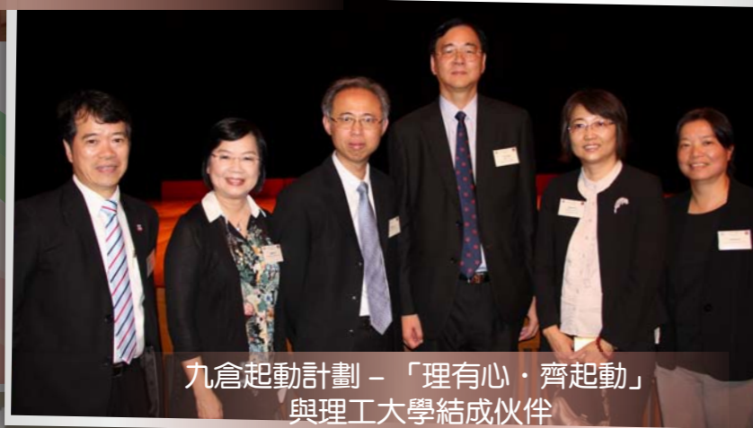
九倉起動計劃 - 「理有心·齊起動」與理工大學結成伙伴