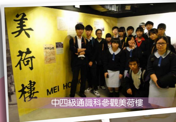
中四級通識科參觀美荷樓