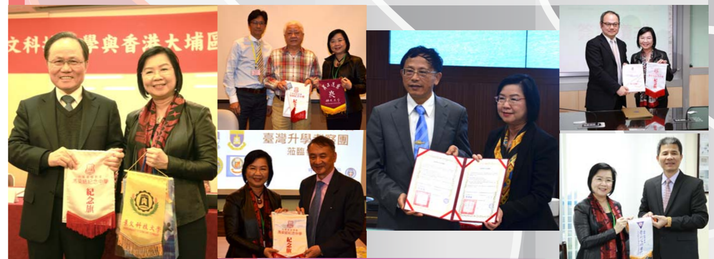
本校校長與台灣六間大學校長簽約結盟

與我校結盟的這幾間大學，為我校於每所大學預留了兩個名額。是次探訪，促進了雙方良好的關係，有利於未來的合作。最近我們在港便接待了好幾位台灣大學校長和教務長。未來兩地學校將有更多交流、互訪，務求使同學得到更多及更新的資訊，在抉擇升學時得到最大的益處。