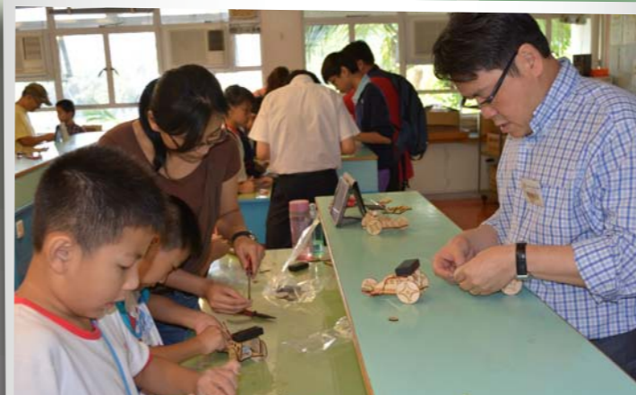
本校老師教授大埔循道衛理小學學生製作太陽能電動車

未來本校會秉承在科技知識方面的探究精神，向「優質教育基金」申請「電子學習及創意科技教育協作供應鏈中心(大埔及北區)」計劃，以進一步推動電子學習及創意科技的發展。