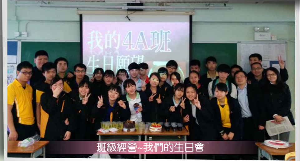
班級經營~我們的生日會