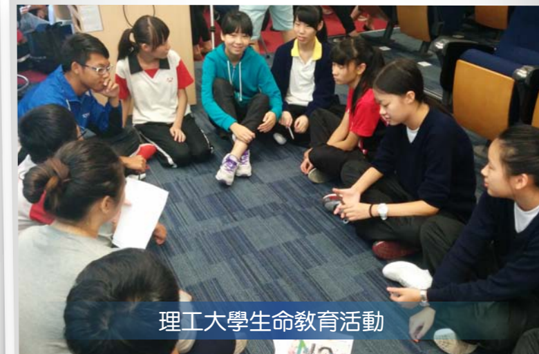
理工大學生命教育活動