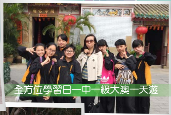
全方位學習日—中一級大澳一天遊