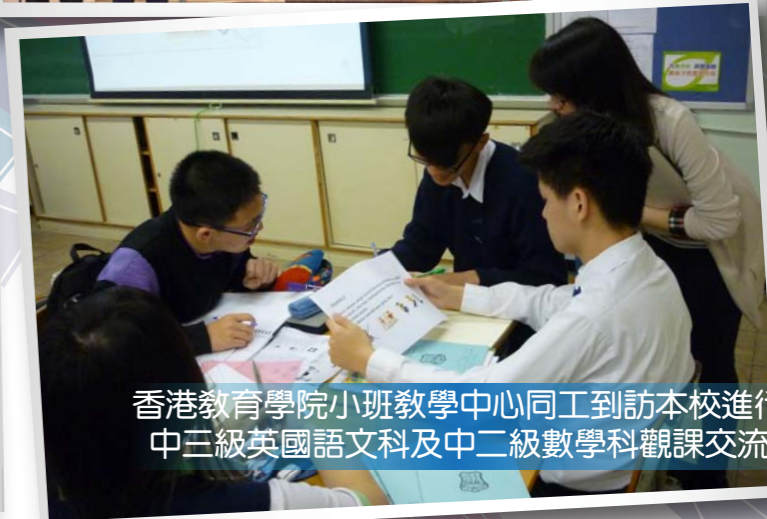
香港教育學院小班教學中心同工到訪本校進行中三級英國語文科及中二級數學科觀課交流