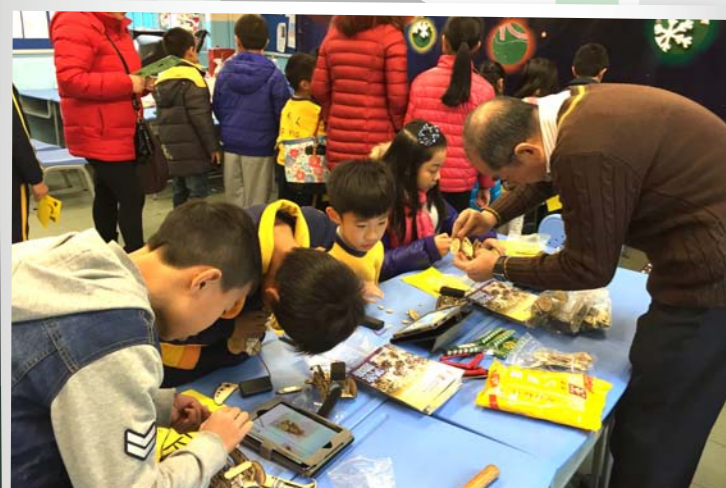
本校老師到打鼓嶺嶺英公立學校參與聖誕聯歡會，並教授小學生製作太陽能車