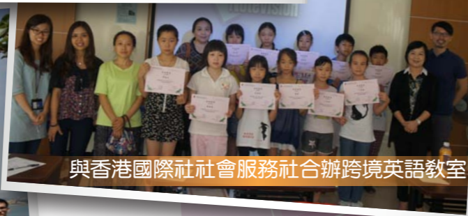
與香港國際社會服務社合辦跨境英語教室