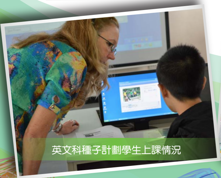
英文科種子計劃學生上課情況