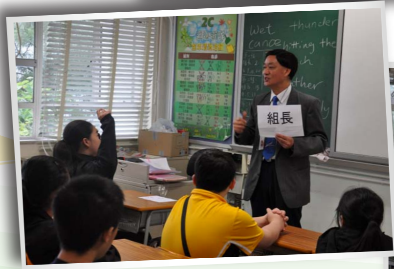
中一級分組溫習及組長訓練