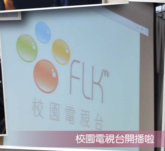
校園電視台開播啦