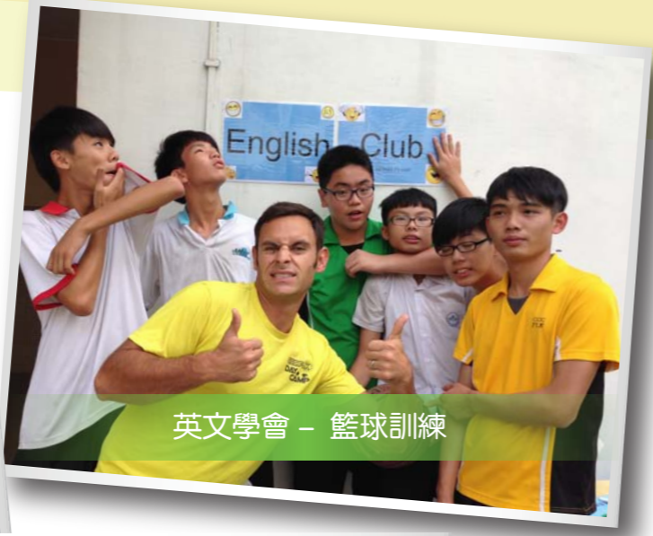
英文學會 - 籃球訓練