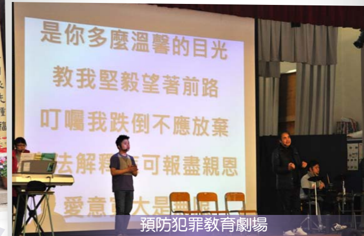
預防犯罪教育劇場