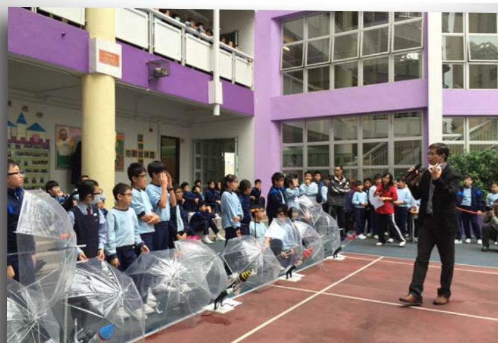
本校老師到上水宣道小學進行水火箭發射示範