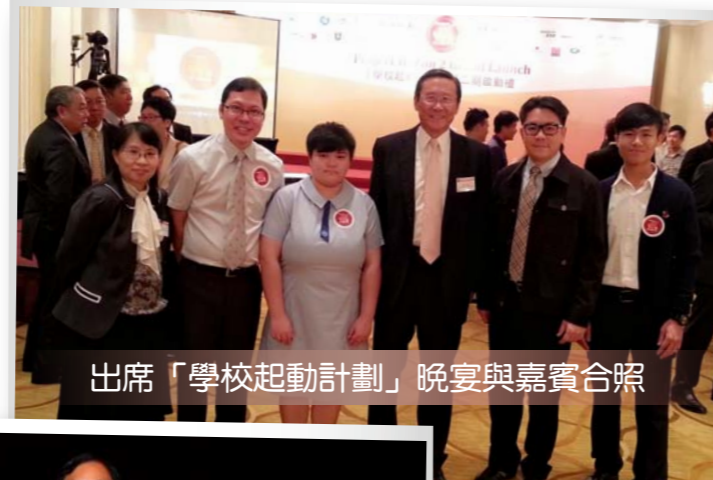
出席「學校起動計劃」晚宴與嘉賓合照