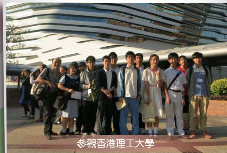
參觀香港理工大學