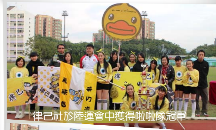
律己社於陸運會中獲得啦啦隊冠軍