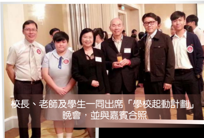
校長、老師及學生一同出席「學校起動計劃」晚宴，並與嘉賓合照