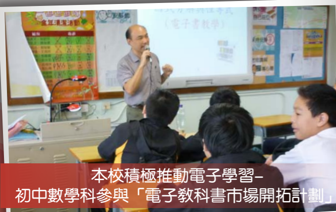
本校積極推動電子學習— 初中數學科參與「電子教科書市場開拓計劃」