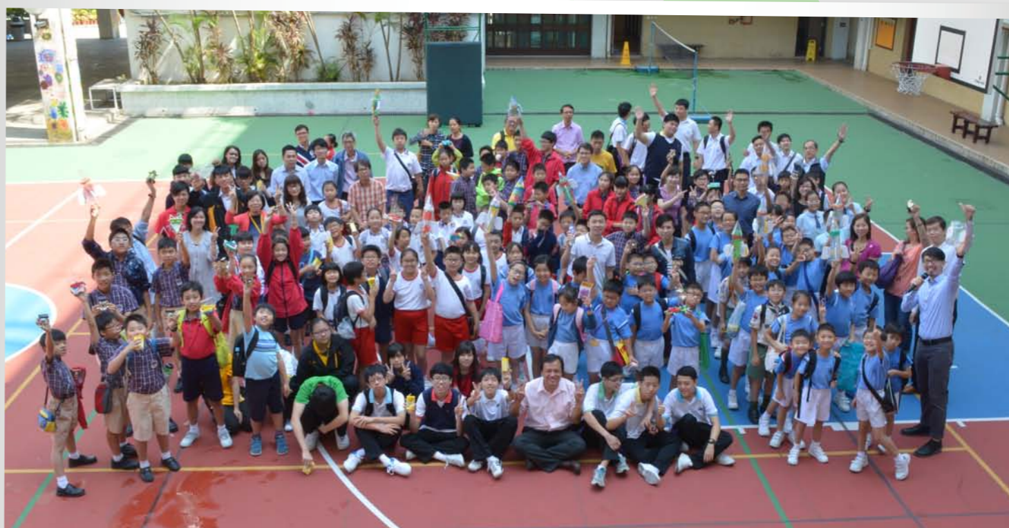
本校師生跟參與科學科技工作坊的小學生大合照