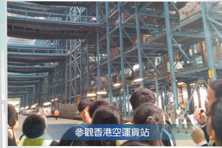
參觀香港空運貨站