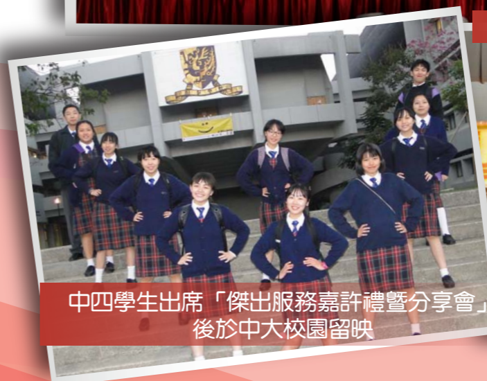
中四學生出席「傑出服務嘉許禮暨分享會」 後於中大校園留映