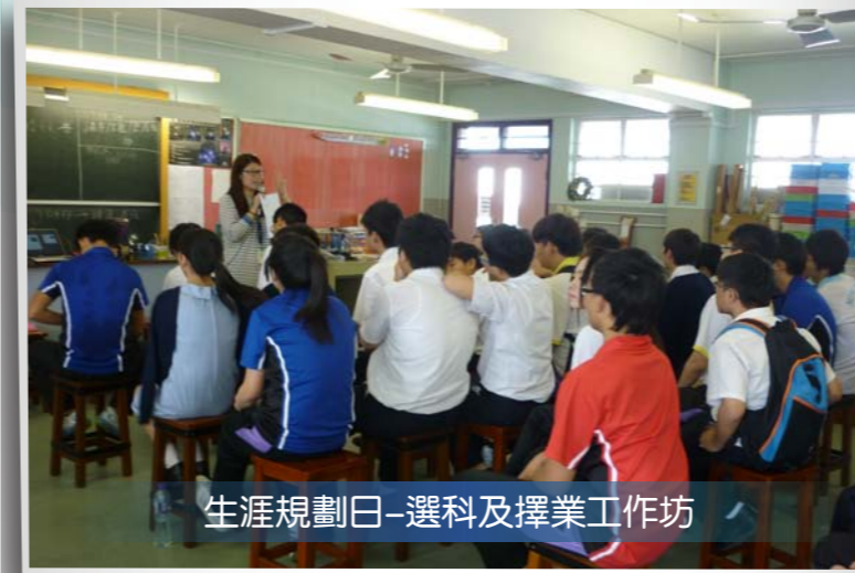
生涯規劃日-選科及擇業工作坊