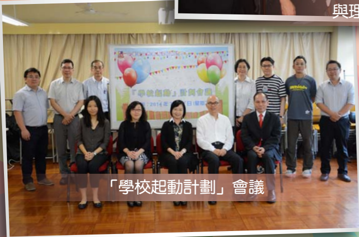
「學校起動計劃」會議