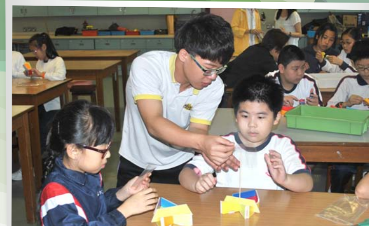
本校老師教授中華基督教會基法小學學生製作風能馬達船