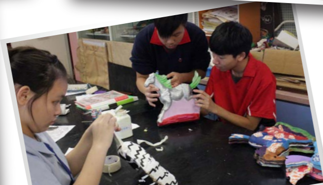
本校學生及聯校生合共一百四十二人製作「悲鴻奔馬紙模」，參與「萬馬奔騰·萬眾一心」裝置藝術展，並申報成為健力士世界紀錄