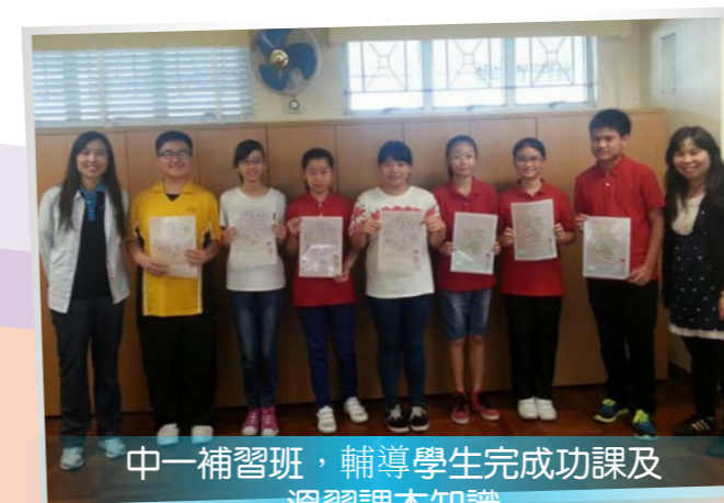
中一補習班，輔導學生完成功課及溫習課本知識