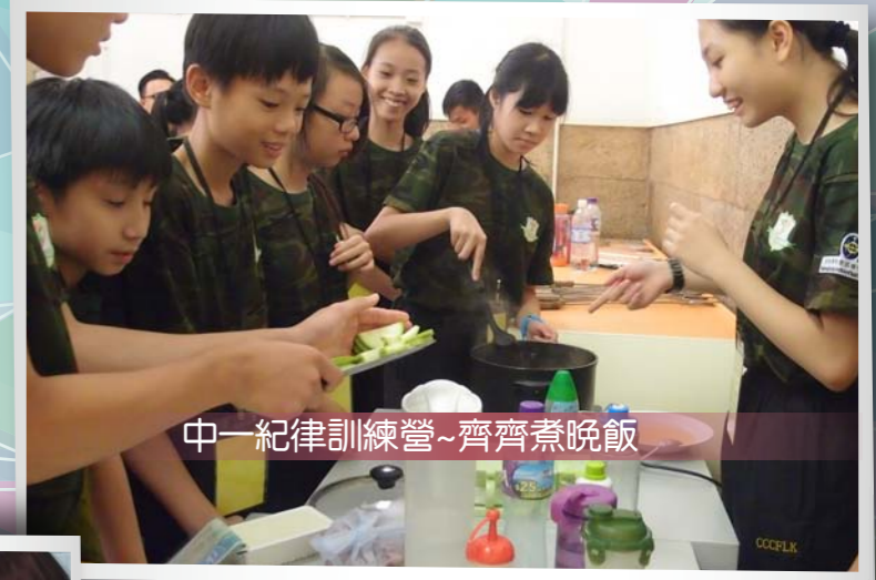
中一紀律訓練營~齊齊煮晚飯