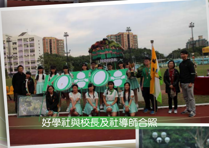
好學社與校長及社導師合照