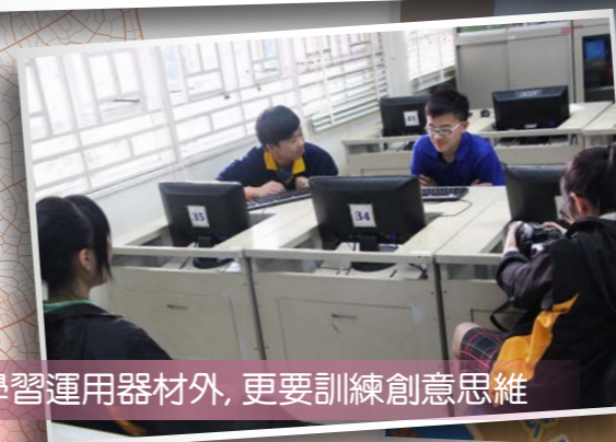
除了學習運用器材外，更要訓練創意思維