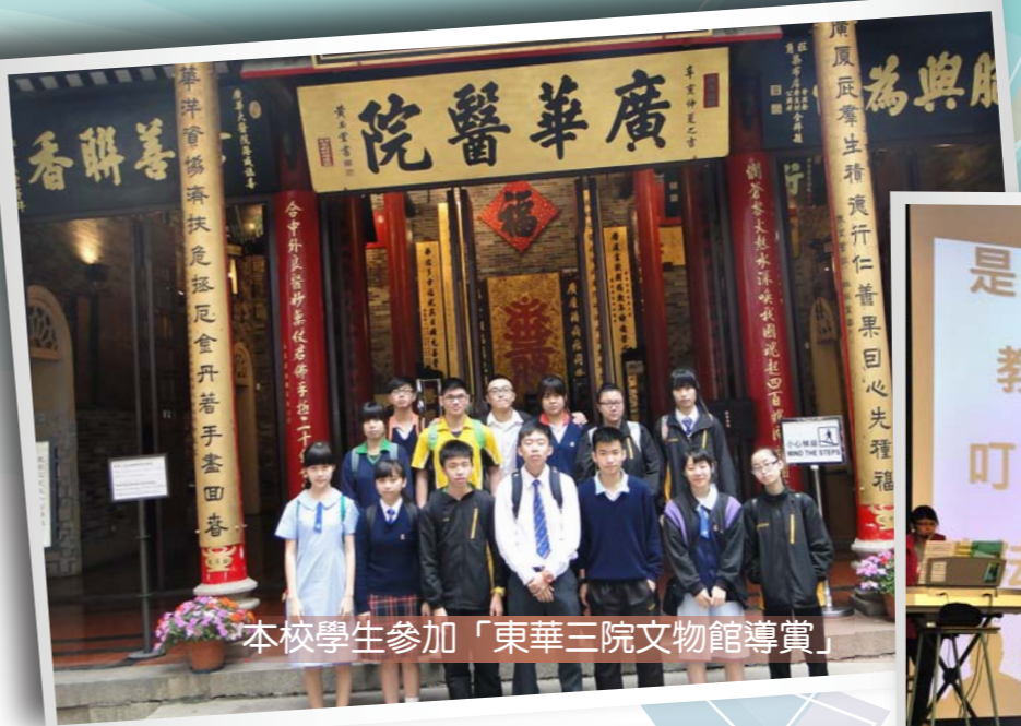
本校學生參加「東華三院文物館導賞」