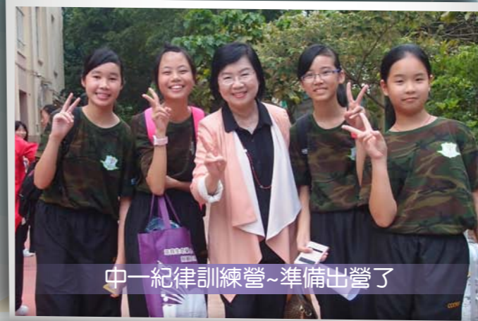
中一紀律訓練營~準備出營了