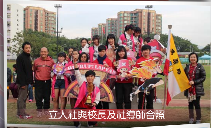
立人社與校長及社導師合照