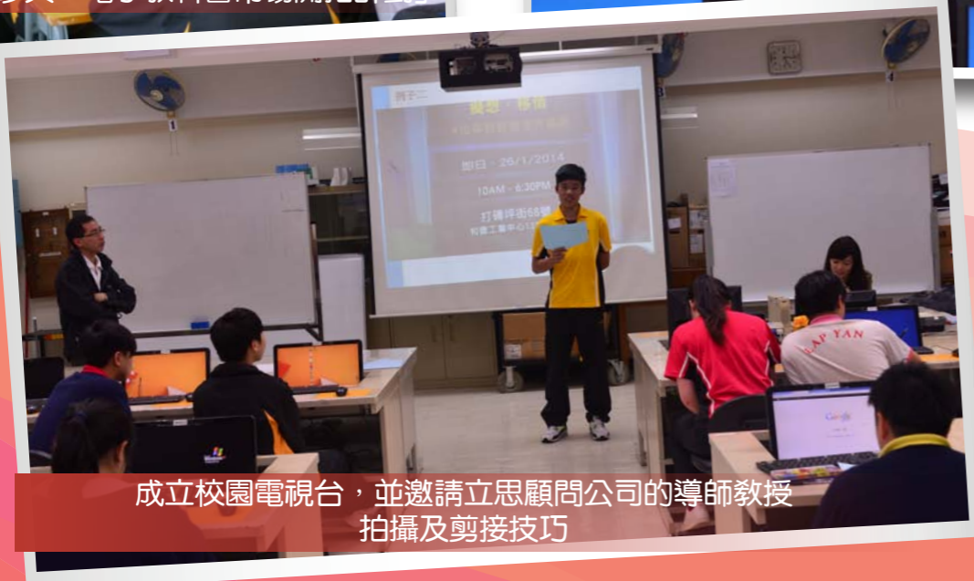
成立校園電視台，並邀請立思顧問公司的導師教授 拍攝及剪接技巧