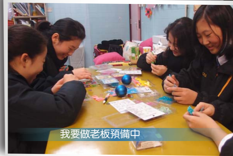
我要做老板預備中