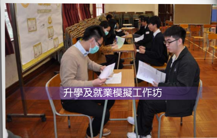
升學及就業模擬工作坊