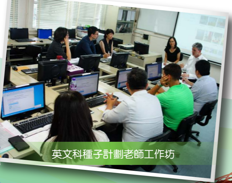
英文科種子計劃老師工作坊