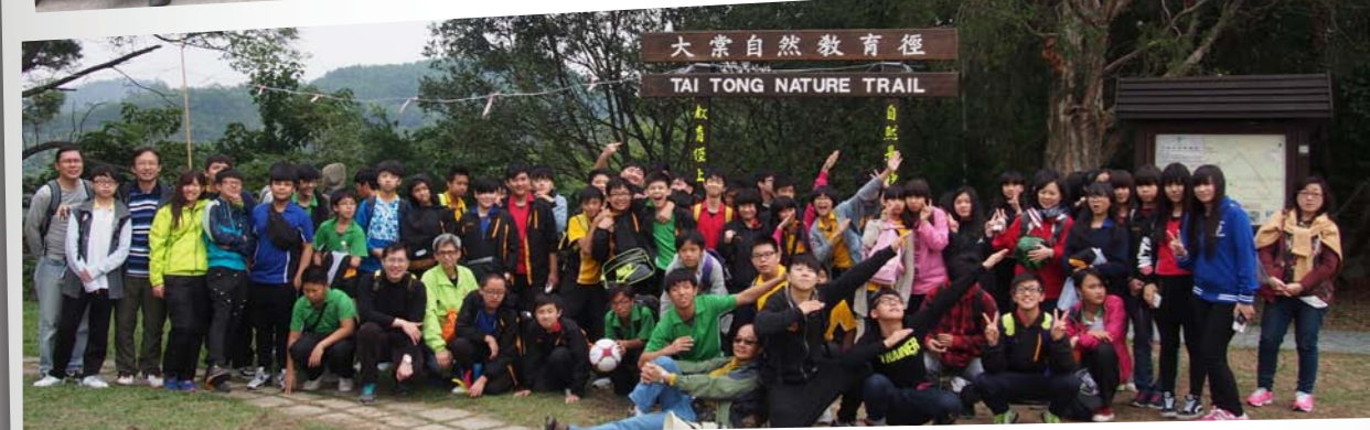
大棠自然教育徑 TAI TONG NATURE TRAIL