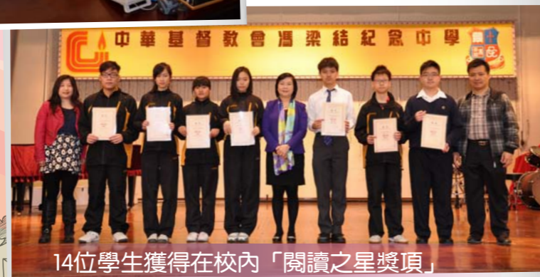
14位學生獲得在校內「閱讀之星獎項」