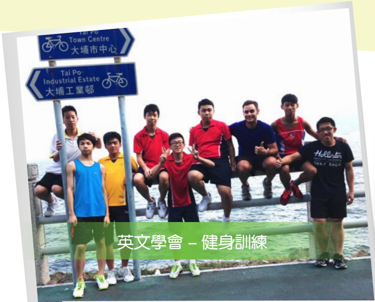
英文學會 - 健身訓練

Language teaching is our top priority. We use different means to encourage students to learn English. We aim to build up students' confidence in using English as the medium of learning. Therefore, we strive to create an environment for using and speaking English where students not only have more chances of using English, but also strengthen and consolidate their language proficiency. Last but not least, we aim to build up a team of teachers who are qualified and confident in using English to teach their own subjects in order to raise the effectiveness of learning and teaching.