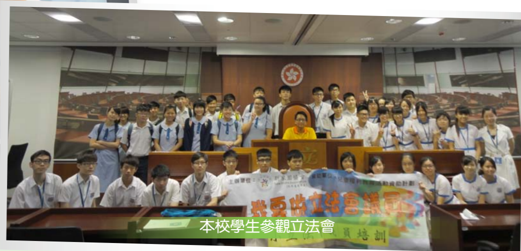
本校學生參觀立法會