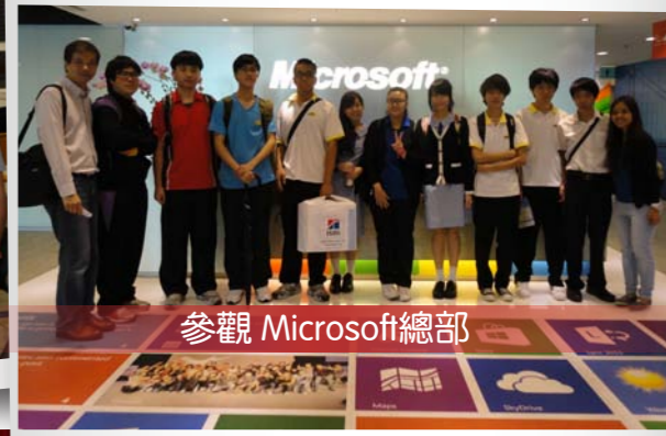
參觀 Microsoft 總部