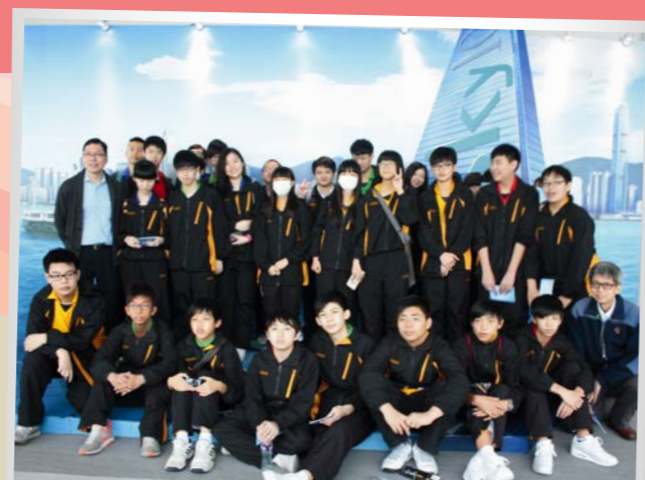
推行全方位學習日