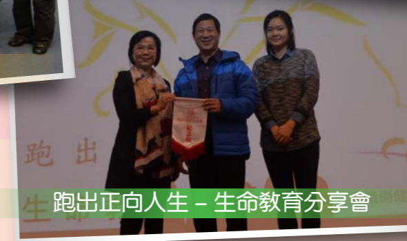
跑出正向人生 - 生命教育分享會