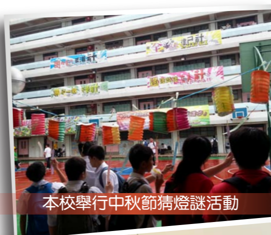
本校舉行中秋節猜燈謎活動