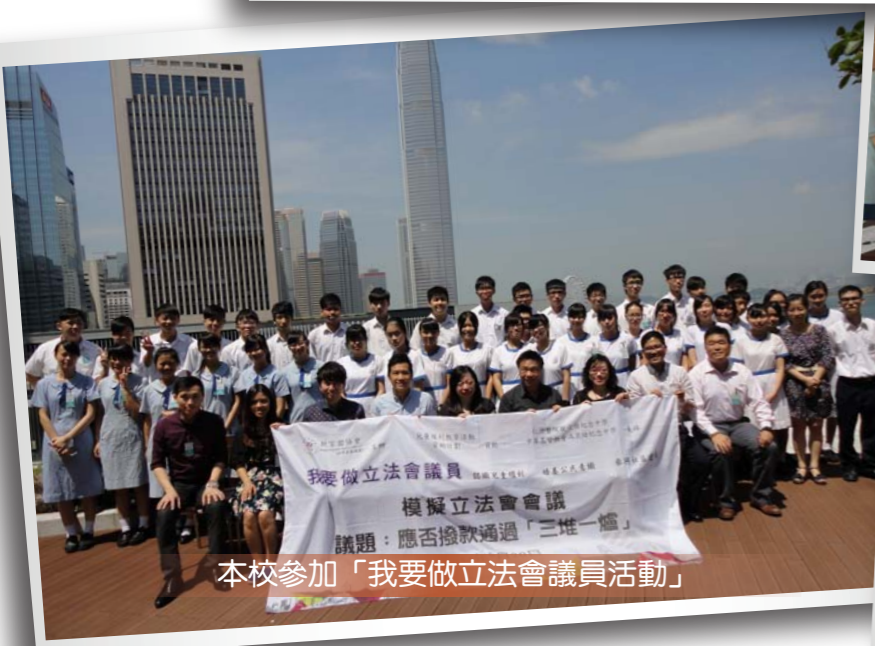
本校參加「我要做立法會議員活動」