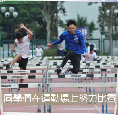
同學們在運動場上努力比賽