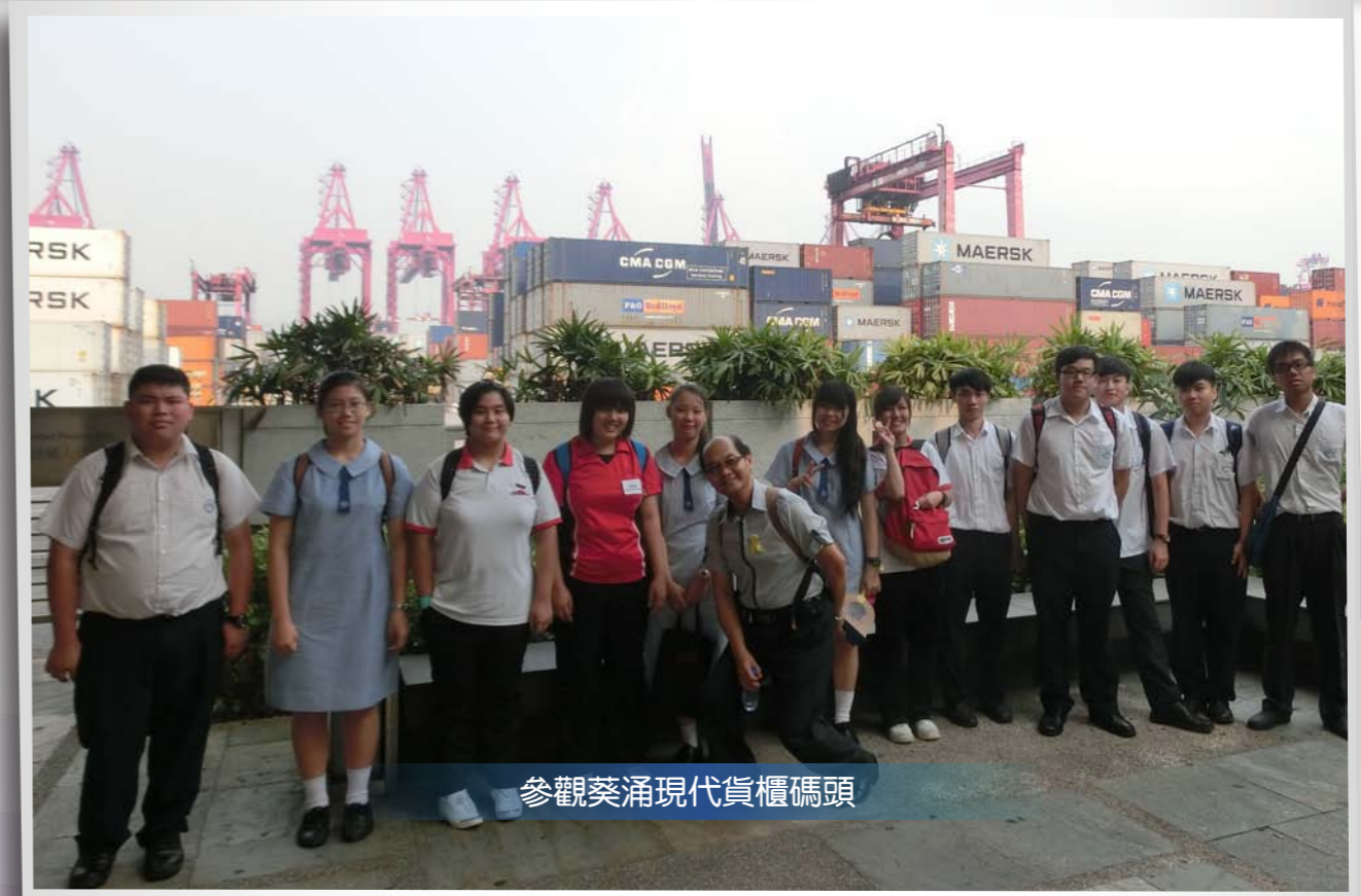
參觀葵涌現代貨櫃碼頭