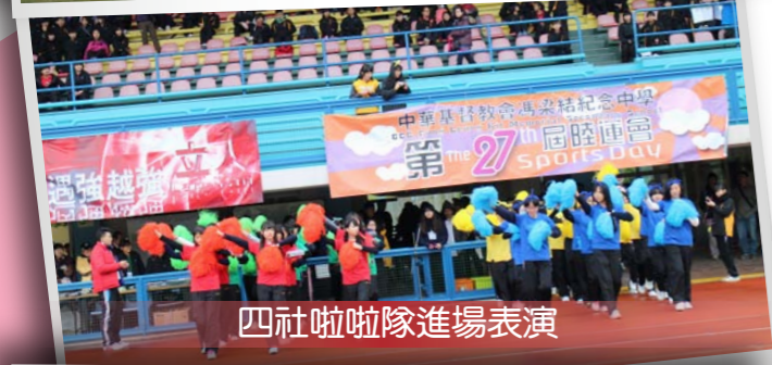
四社啦啦隊進場表演