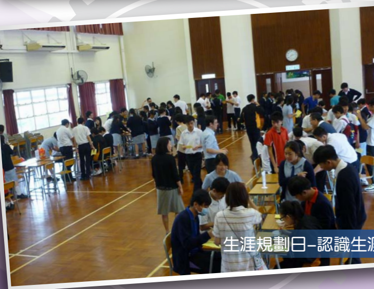
生涯規劃日-認識生涯規劃及了解自我講座