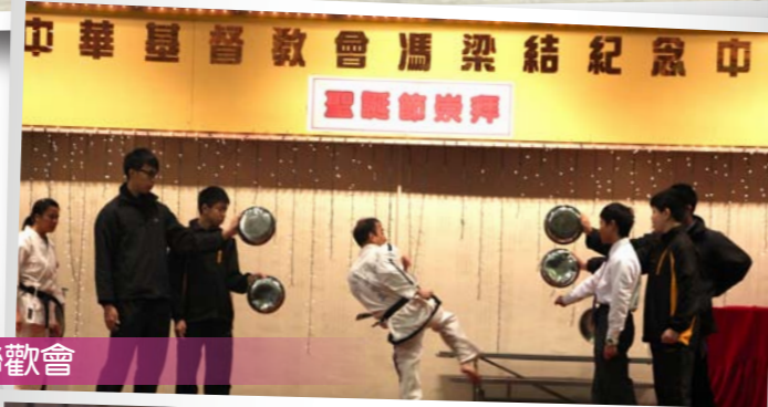
中華基督教會馮梁結紀念中 聖誕節慶祝