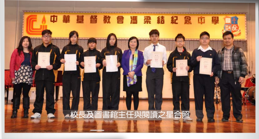
校長及圖書館主任與閱讀之星合照