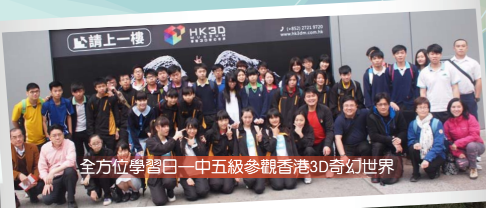
全方位學習日—中五級參觀香港3D奇幻世界