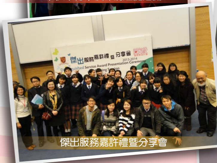
傑出服務嘉許禮暨分享會