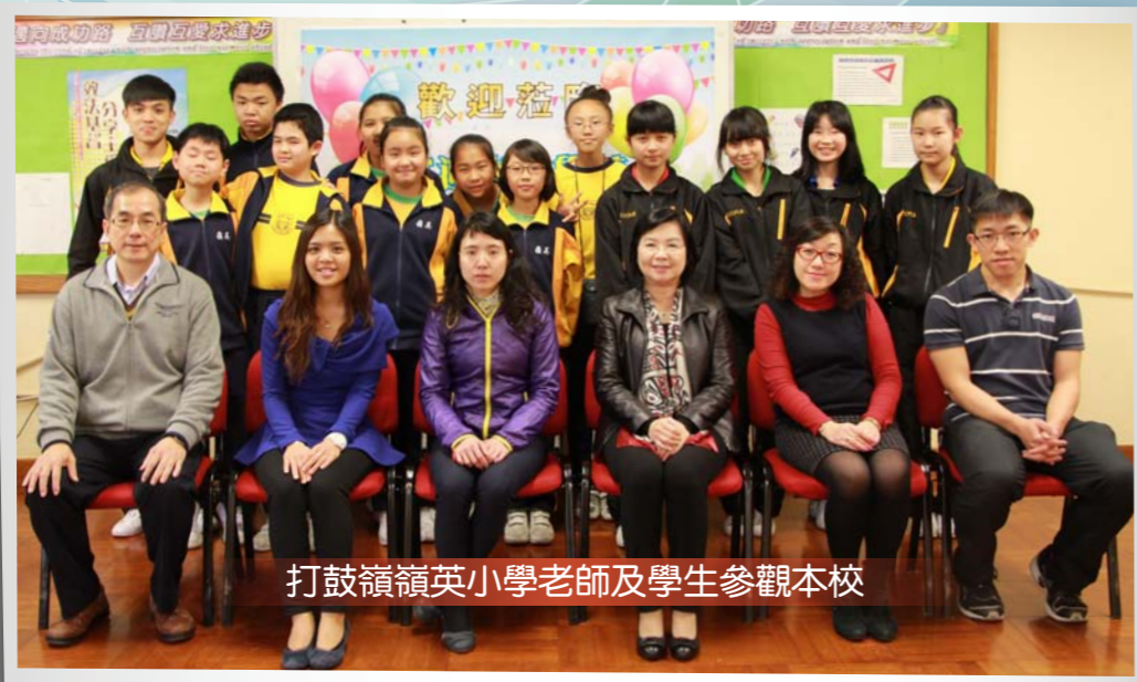
打鼓嶺嶺英小學老師及學生參觀本校