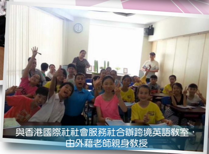
與香港國際社會服務社合辦跨境英語教室，由外籍老師親身教授