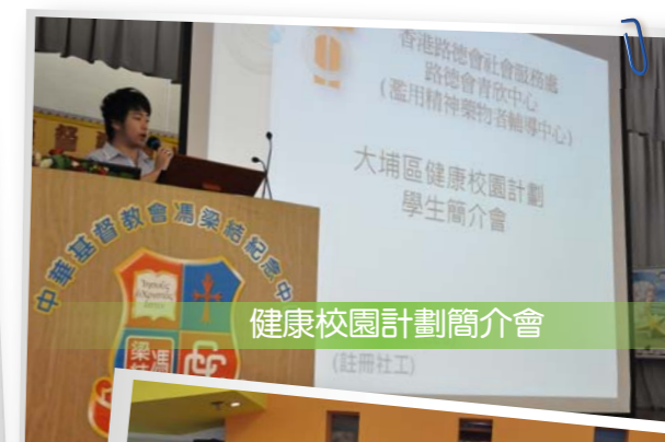
健康校園計劃簡介會 (註冊社工)