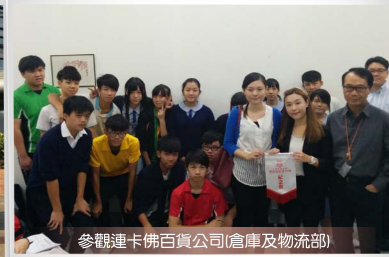
參觀連卡佛百貨公司(倉庫及物流部)