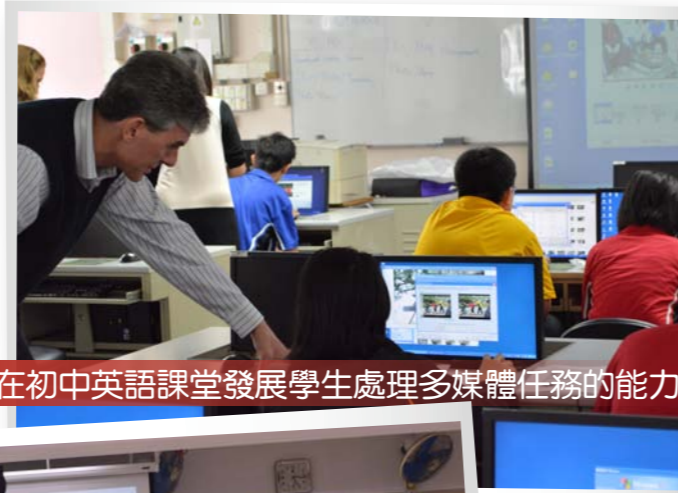
在初中英語課堂發展學生處理多媒體任務的能力