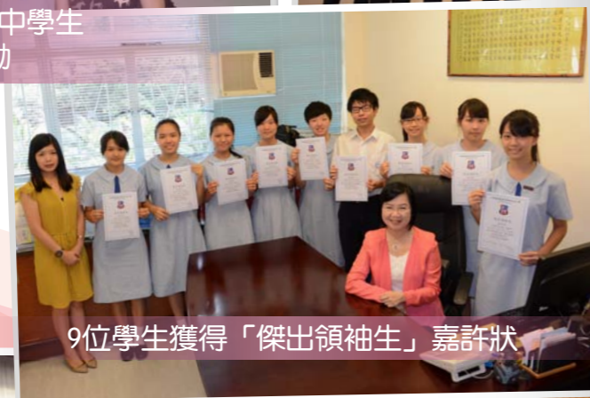
9位學生獲得「傑出領袖生」嘉許狀