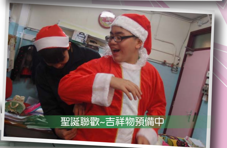
聖誕聯歡~吉祥物預備中