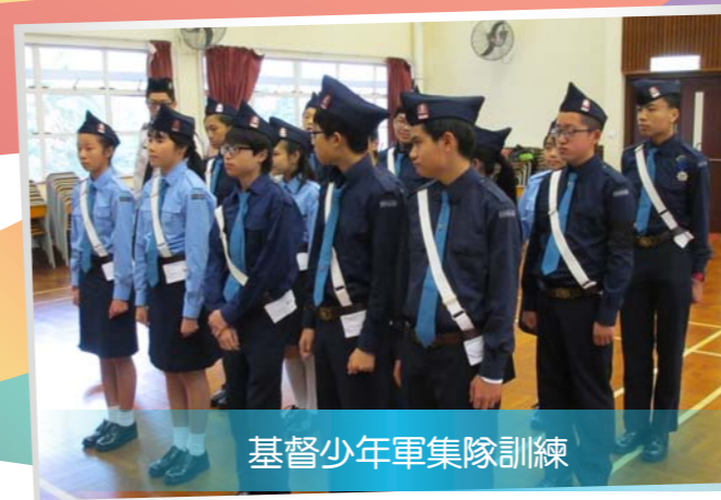
基督少年軍集隊訓練

看見學生星期六全日在教會享受充實而開心的一天，生命因而成長，令一班有承擔的義務導師充滿感恩！得到眾多家長對校牧事工的肯定和支持，在此表示衷心感謝！