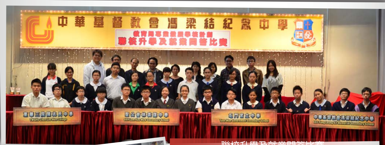
聯校升學及就業問答比賽