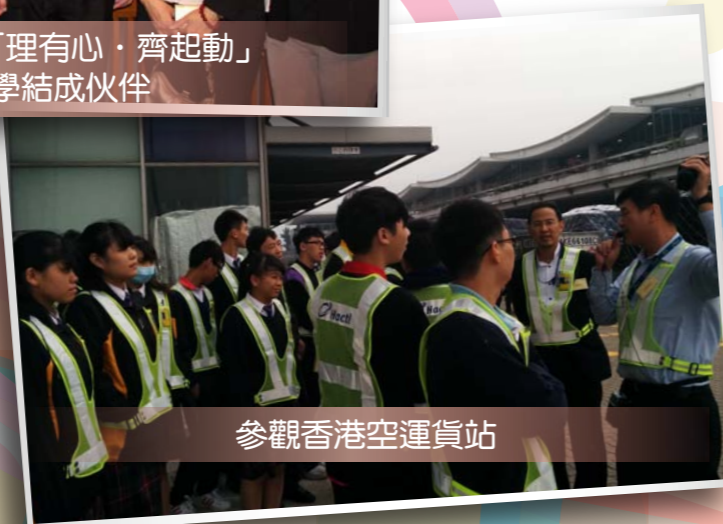
參觀香港空運貨站