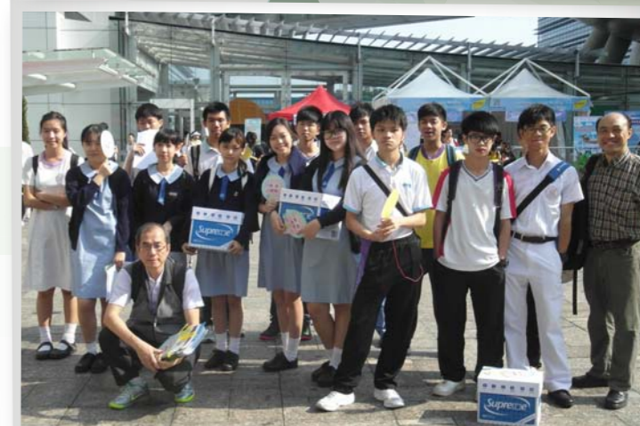
學生們參加2014 應用可再生能源設計暨競技大賽