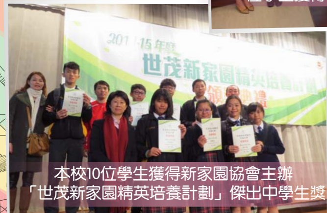
本校10位學生獲得新家园協會主辦「世茂新家园精英培養計劃」傑出中學生獎