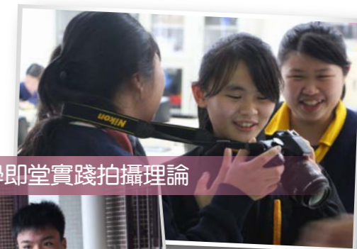
同學即堂實踐拍攝理論