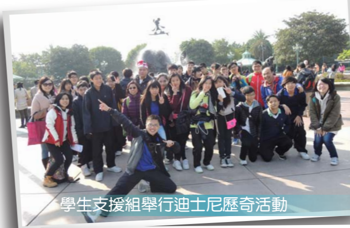
學生支援組舉行迪士尼歷奇活動