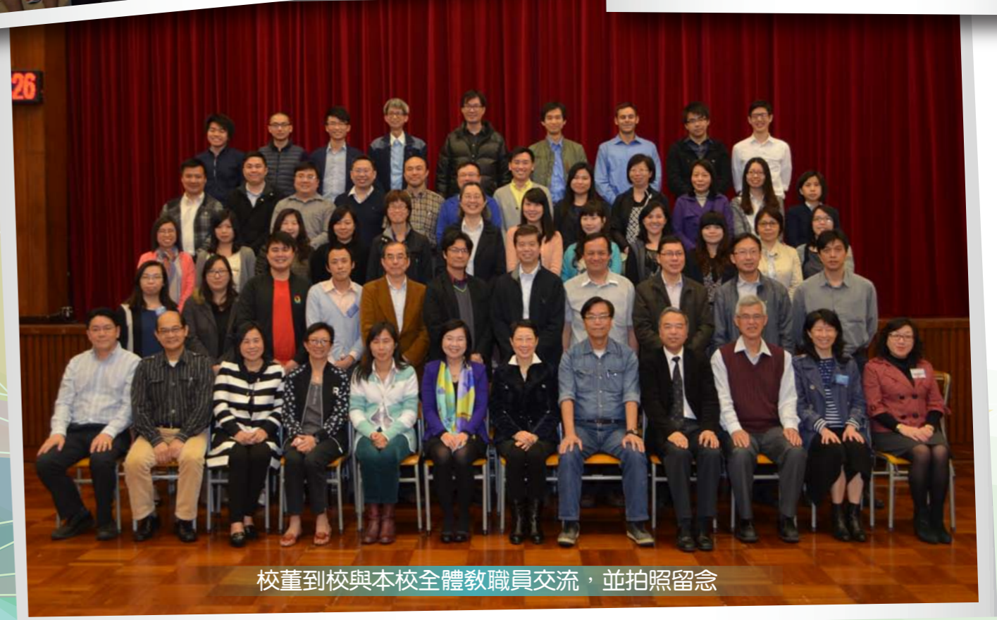
校董到校與本校全體教職員交流，並拍照留念