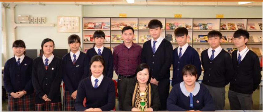
本校戲劇學會於2015年大埔區中、小學戲劇比賽中獲得「良好整體演出」