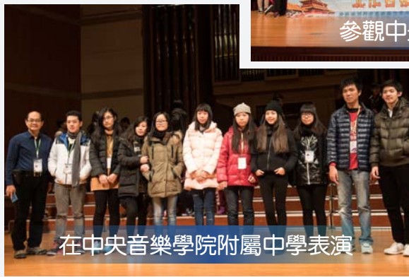
在中央音樂學院附屬中學表演