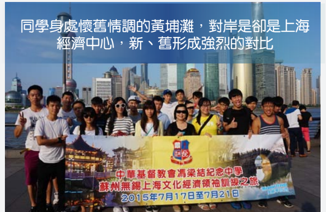
同學身處懷舊情調的黃埔灘，對岸是卻是上海經濟中心，新、舊形成強烈的對比