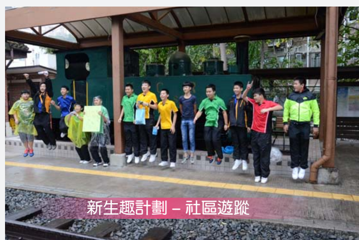
新生趣計劃 - 社區遊蹤