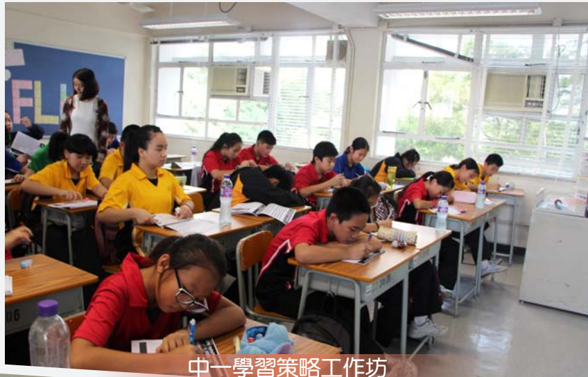
中一學習策略工作坊