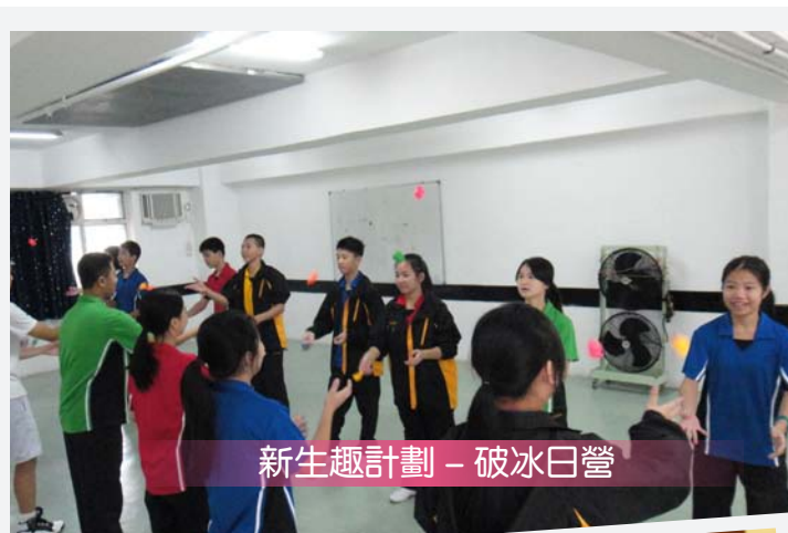
新生趣計劃 - 破冰日營