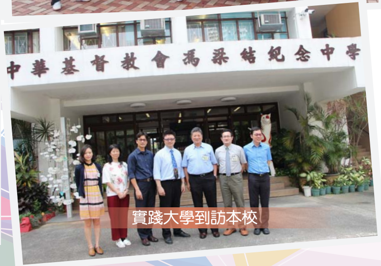
實踐大學到訪本校