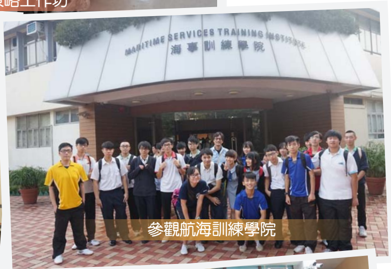
參觀航海訓練學院