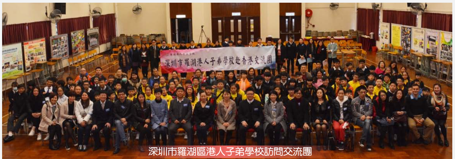
深圳市羅湖區港人子弟學校訪問交流團