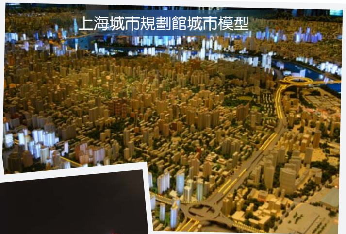
上海城市規劃館城市模型