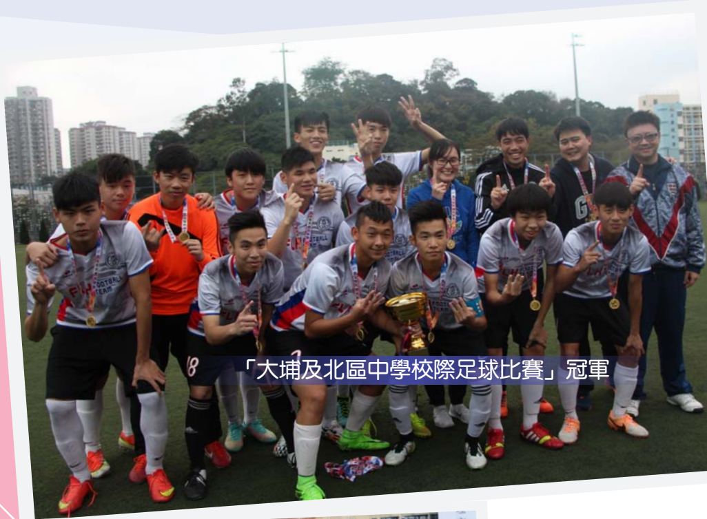
「大埔及北區中學校際足球比賽」冠軍