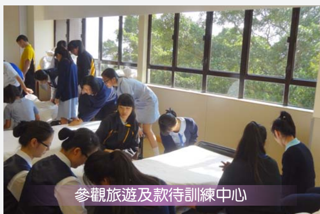
參觀旅遊及款待訓練中心