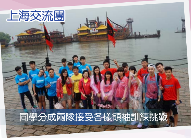
同學分成兩隊接受各樣領袖訓練挑戰