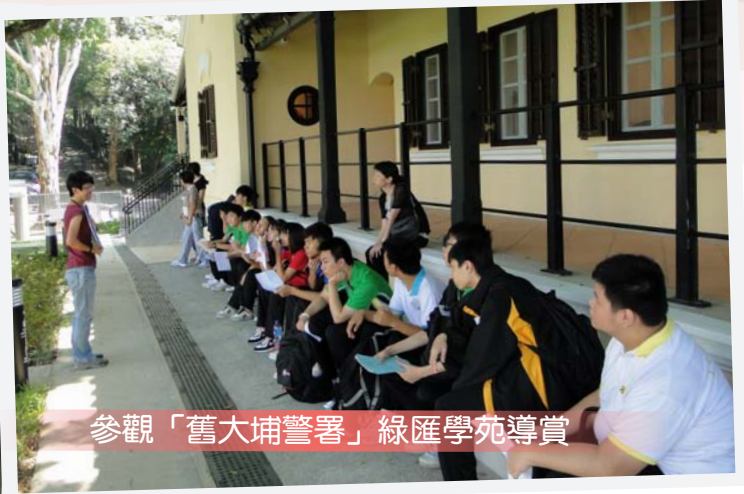
參觀「舊大埔警署」綠匯學苑導賞