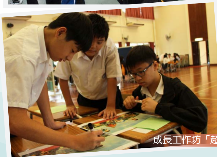
成長工作坊「超級能力獎門人」