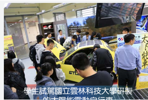
學生試駕國立雲林科技大學研製的太陽能電動自行車