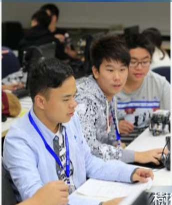
樹德科技大學設計大樓前留影