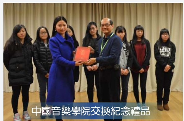
中國音樂學院交換紀念禮品