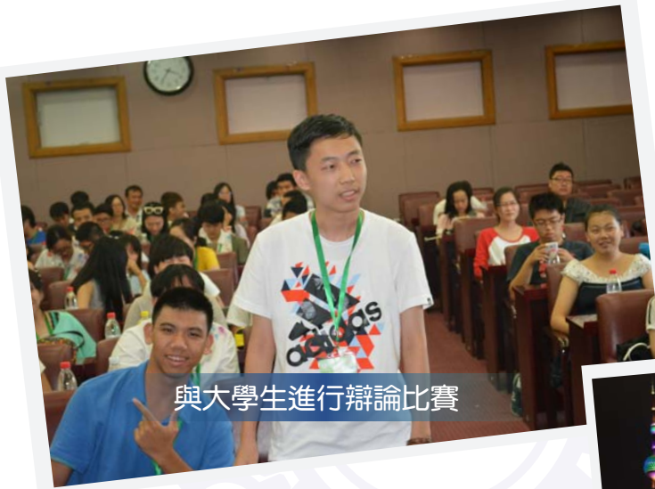
與大學生進行辯論比賽

參觀北京對外經濟貿易大學，與大學生作即場的辯論及交流亦是難得的體會，此外，遊覽長城、蘆溝橋、人民大會堂、上海東方明珠塔及黃埔江等名勝，讓學生了解中國的歷史事蹟及發展。參觀北京的新發展區及上海城市規劃館等，亦讓學生認識到北京及上海的城市規劃，如何發展新城市，大大擴闊了學生的視野，更可作香港新市填發展的借鏡。