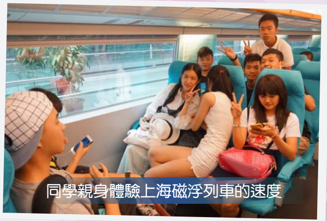
同學親身體驗上海磁浮列車的速度