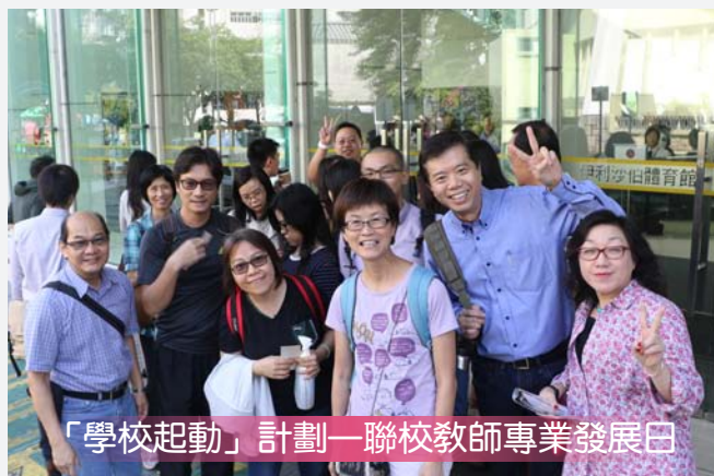
「學校起動」計劃—聯校教師專業發展日