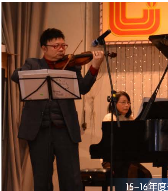
15-16年度聖誕聯歡會表演

未來，我們會繼續為孩子提供多元化的學習體驗：生涯規劃活動日、選科講座、校友分享會、升學及就業工作坊、國內及國外升學交流團、暑期試工計劃等等，藉著不同的造就，在你我的陪伴下，讓孩子繪畫專屬自己的人生藍圖，追尋心中的亮光！