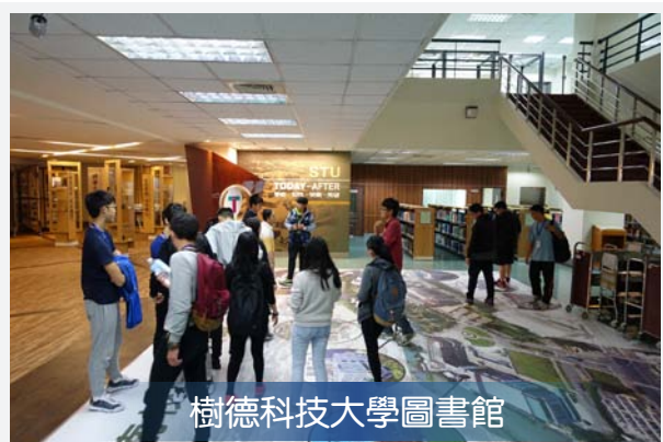
樹德科技大學圖書館