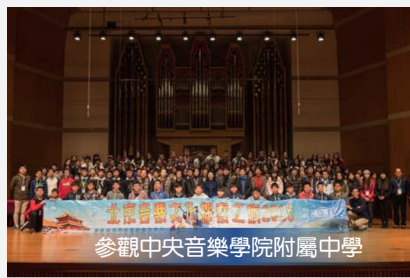
參觀中央音樂學院附屬中學