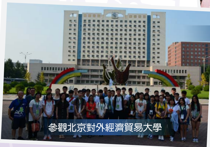
參觀北京對外經濟貿易大學