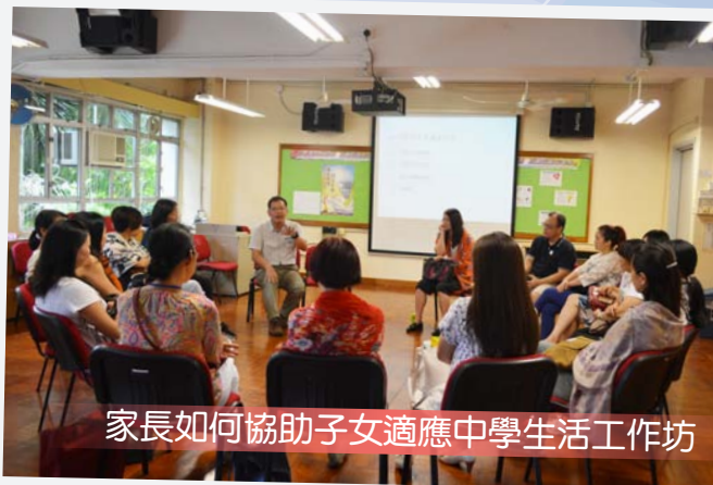
家長如何協助子女適應中學生活工作坊