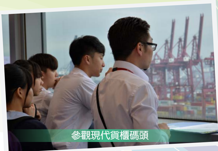
參觀現代貨櫃碼頭