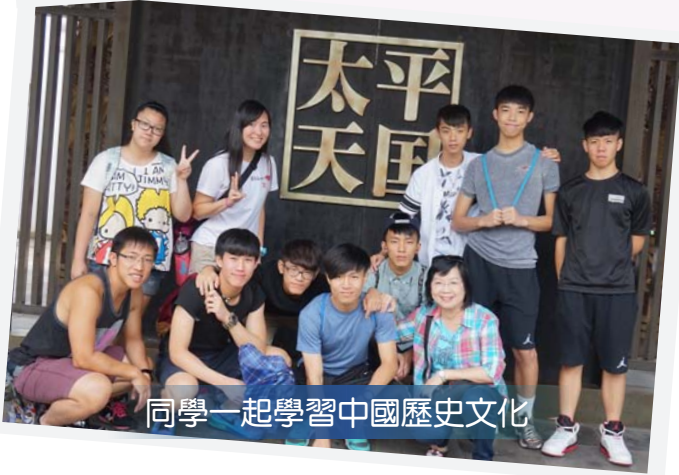
同學一起學習中國歷史文化