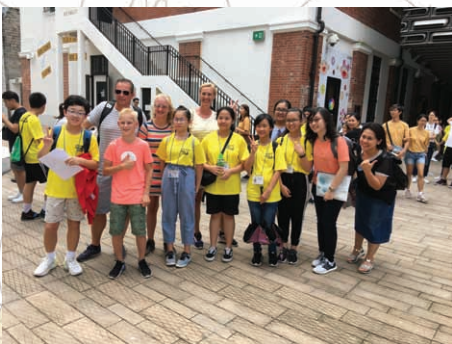
中一英語說話訓練