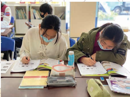
廣東話及英語課後輔導班