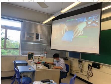
中一跨境實體教室